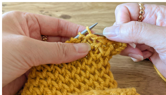
Ici, tricoter 1 m end

Rang 6 : 1 m env, *1 m end, avec l'aig droite soulever le fil (situé sur l'aig gauche) qui a glissé au rang précédent et le tricoter ensemble à l'end avec la m qui le surmonte*, répéter de * à * et terminer par 1 m env.