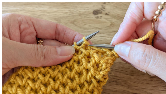
Ici, tricoter 1 m dbl

Rang 5 : 1 m end, *1 m dbl, 1 m end*, répéter de * à * et terminer par 1 m end.